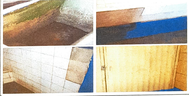
Foto 4: Puerta de lamina para poder sustituir por metal, pila y azulejo