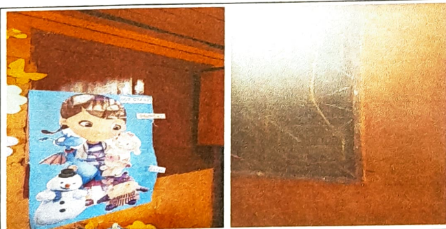
Foto 5: Ventanas de madera en mal estado para sustituir por metal con vidrio